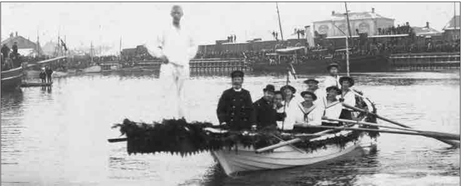
Figur 12. Fiskeriforeningens Dystløb i 1909 blev igen afholdt i Østerhavnen. Her ses en af dystløberne parat til kamp; i baggrunden ses Nyborgs anden banegård på Dampskibsmolen. Læg mærke til de mange tilskuere på kajen og på fiskeriinspektionsdamperen »Falken«, som før dystløbet havde kørt rundt i grødisen for at skaffe åbent vand.