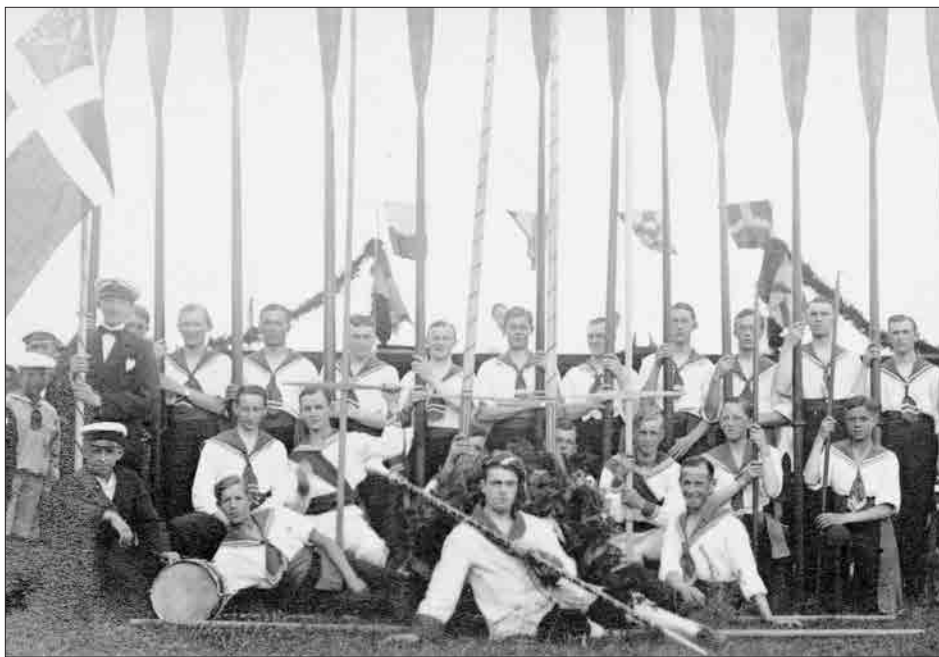
Figur 9. Gruppebillede af dystløbere og chalup-roere i hvide dragter med matroskraver – smukt opstillet med rejste årer i anledning af dystløbet den 23. februar 1902.

Lige under annoncen, der gør byens borgere opmærksom på dystløbet, er anbragt denne lille annonce hen- vendt til roklubbens medlemmer: