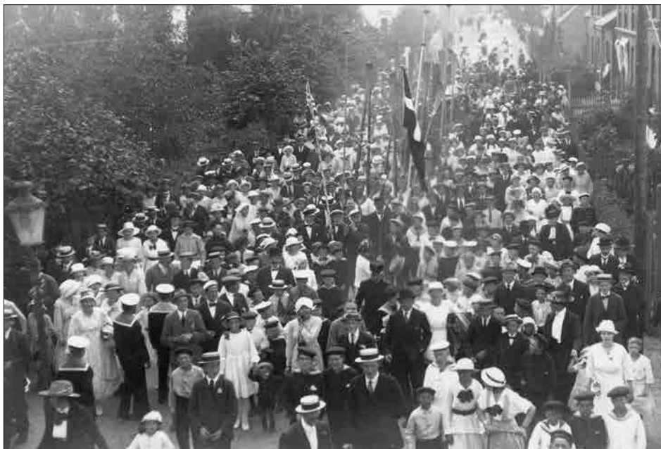
Figur 16. Endnu et stort dystløbs-optog går ad Christianslundsvej på vej mod Nyborg Strand en sommerdag i 1920'erne.