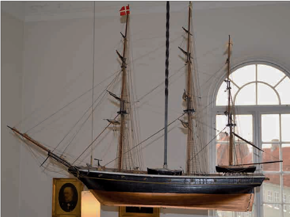
Figur 7. Sølavets skib »Kronprins Frederik«, der i 1862 var skænket til Rådhuset i anledning af dets ombygning, og som blev båret af fire skippere i dystløbs-optøget gennem byen. Det hænger i dag øverst i trappeopgangen til byrådsalen på Rådhuset i Nyborg.

snarere kunde tælles i Tusinder end i Hundreder, selvfølgelig en galla, samlede sig ved Raadhuset og gik derfra i Høitidsfølge med Faner og Flag, med Musik i Spidsen og med en Krands eller Krone paa flere Etager, smagfuldt ordnede med Grønt og Roser, og prydet paa sin Top med to Figurer, der hentydede til Festens Anledning. I Rækkerne dannedes Kjernen af Søfolket, som bar et lille Skib, der ellers smykker Raadhuset; men fremmest blandt Alle tiltrak de to udvalgte Dystkæmpere sig Opmærksomheden: »de vare sikkert – enhver Anden af Byens raske unge Sømænd ufortalt – Blomsten af vor søfarende Ungdom, to høie, slanke