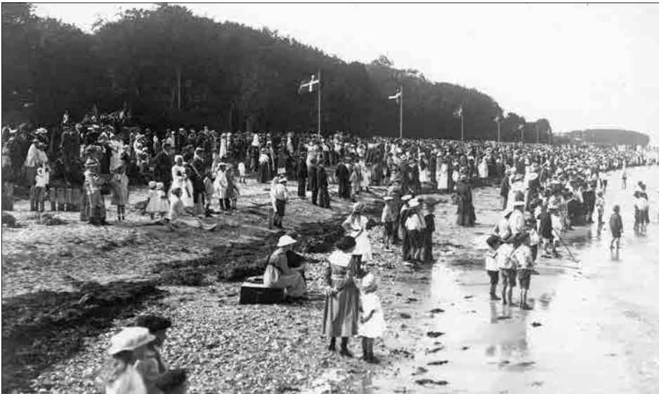
Figur 15. Også om sommeren kunne dystløbene samle mange tilskuere. Her ved Nyborg Strand i 1910'erne. Desværre kan man ikke se selve dystløbet, men de mange tilskuere viser, at det var noget af en begivenhed.