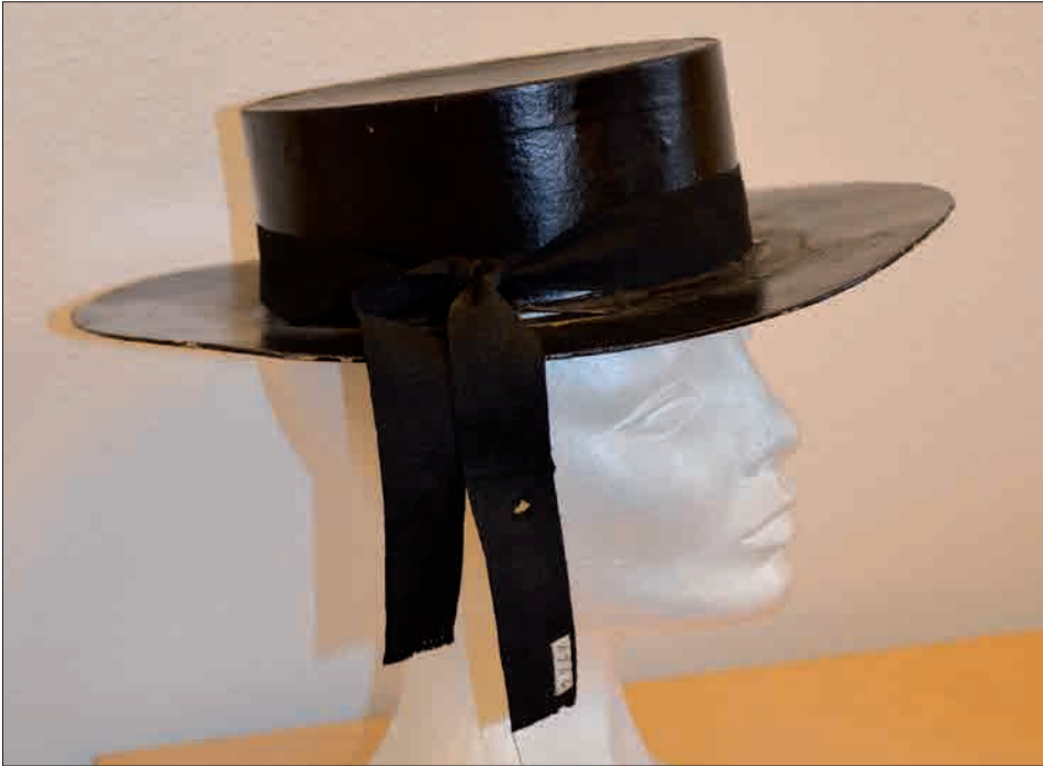
Figur 14. I Østfyns Museers magasin i Nyborg ligger også denne dystløber-hat, som er magen til den, de to flotte dystløbere bærer på figur 13.