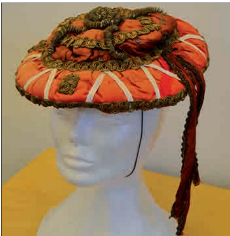
Figur 5. Ole Bunkes originale dystløber-baret, som også findes i Østfyns Museers magasin i Nyborg. Desværre mangler »Fjedrene«, som efter beskrivelsen skulle have været røde og hvide.