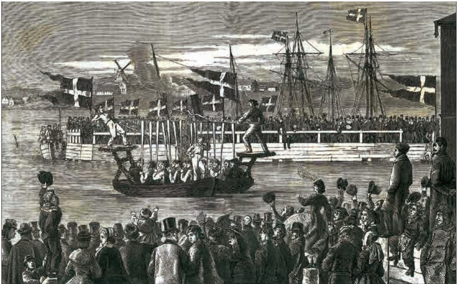
Figur 2. Dystlegen i Nyborg den 30te Januar 1866. Efter en tegning af K. Gamborg. Xylografi fra Illustreret Tidende, Årgang 7, Nr. 334, 18/02-1866, s. 177.

Tirsdagen den 30te Januar afholdtes Dystløberfesten. Veiret havde ikke just lovet det Bedste, da det saavel Dagen, som især Natten forud havde stormet og regnet; men henad Morgen lagde Stormen sig og Himlen klaredes. Gaderne blev feiede og bestrøedes med Sand og Grønt og fra Raadhuset og mange private Bygninger udhængtes Flag. Langs Skibsbroens østre Bolværk stode Flagstænger med Flag, og fra Brohovedet, Toldboden og flere Steder, samt paa alle Skibe i Havnen flagedes.