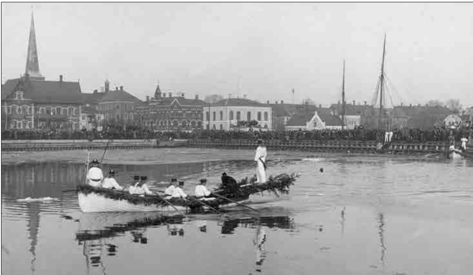
Figur 10. Nyborg Roklubs første dystløb, 23. februar 1902. Som det kan ses, er den inderste del af havnen fyldt med is. Derfor afholdt man dystløbet længere ude i Vesterhavnen.