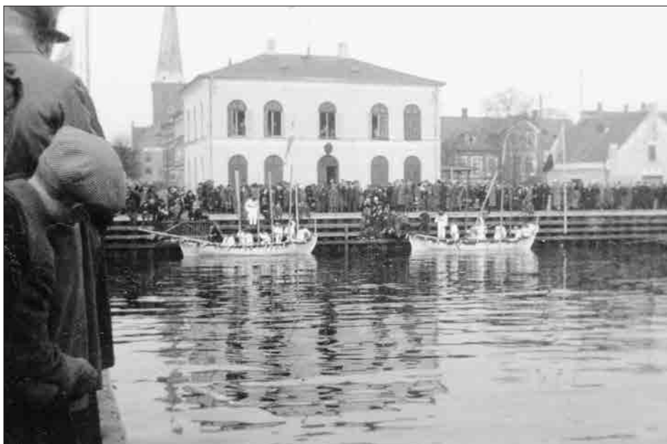
Figur 20. Som det kan ses, var der tæt besat med tilskuere langs bolværkerne til dystløbet den 1. marts 1936.