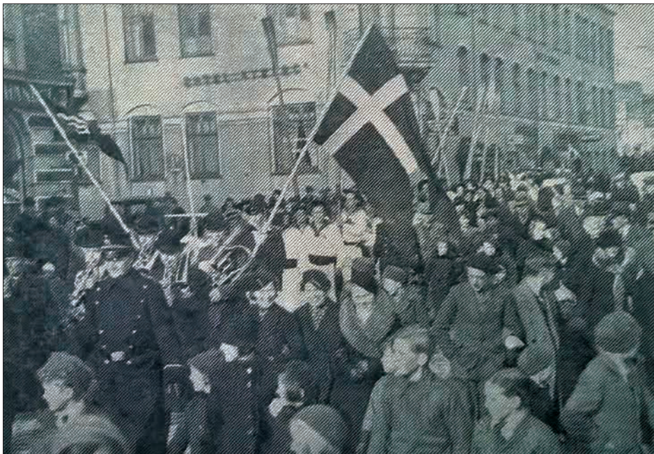
Figur 19. Dystløber-optøget i Adelgade på vej til havnen. Avisfoto, Nyborg Avis , 2. marts 1936.

Skulle man have lyst til at se levende billeder fra et dystløb, kan jeg henvise til denne web-adresse: http://www.danskkulturarv.dk/dr/fynnyborg-1932-1936/ . Det er godt nok ikke filmen fra 1909, men den er alligevel værd at ofre nogle minutter på.