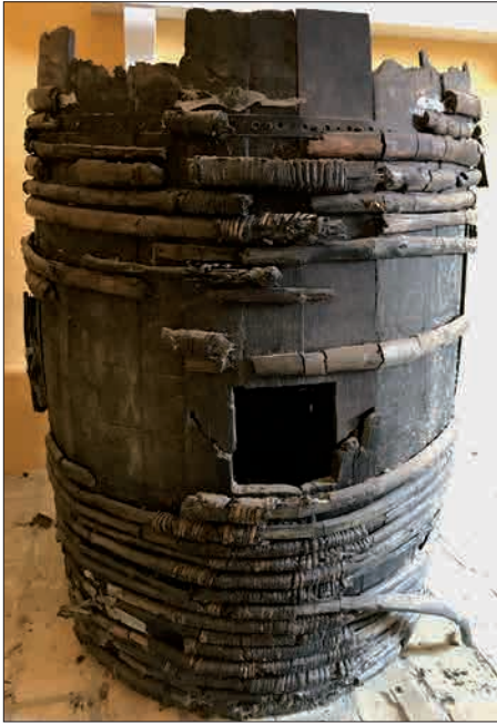
Figur 15. Tønde fra renæssancen. Tønden her blev fundet under udgravninger i Nyborg i gården bag Baggersgade og Nørregade. Den er enten middelalderlig eller fra renæssancen. Den er under alle omstændigheder en original tønde ligesom dem, der har rummet de mange varer, Lerche-familien handlede med, og som Borgmestergården har været fuld af.

lige ærinder. I de nye udstillinger på Borgmestergården kan man nu gå på yderligere opdagelse i livet i renæssancens Nyborg i et større kulturhistorisk lys.