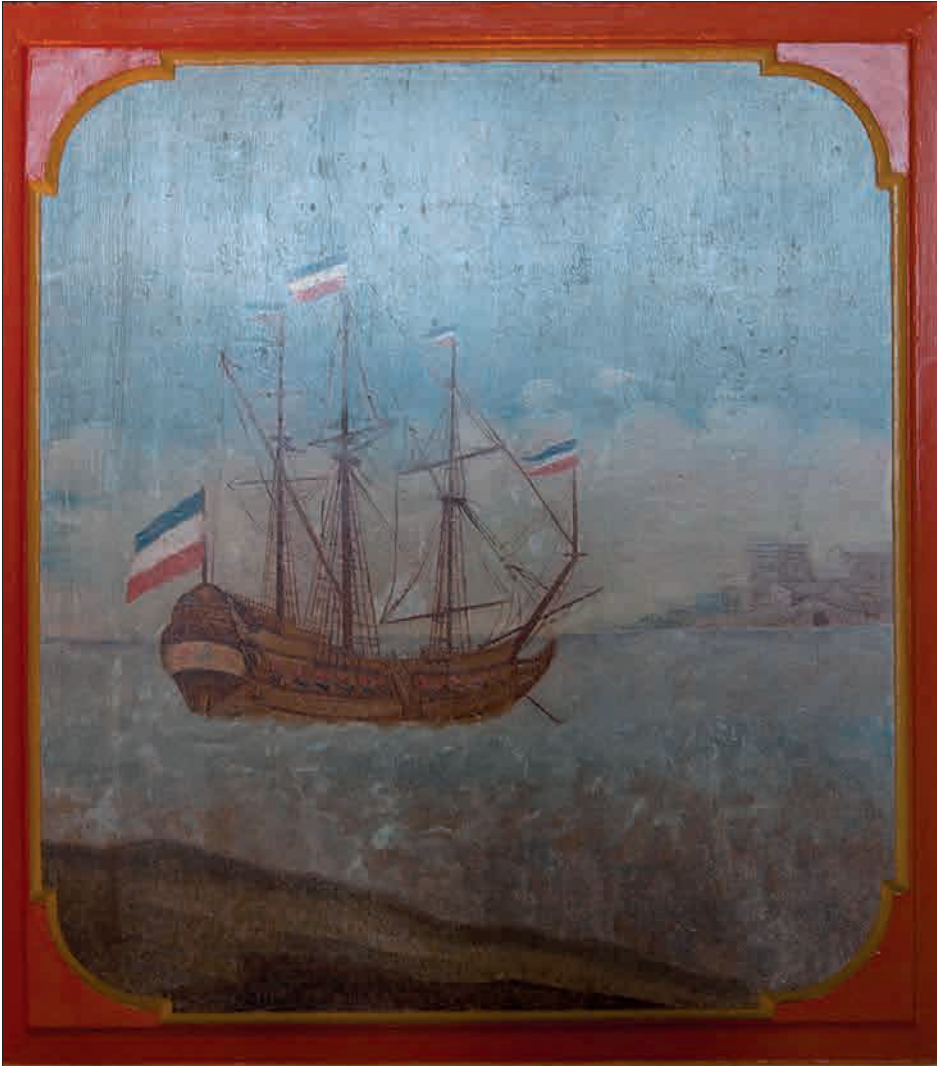
Figur 14. Skib fra 1700-tallet afbilledet på væggen i panelstuen på Borgmestergården. Skibsmotiverne og de maritime landskaber vidner om byens rolle som handels- og søfartsby.

borgmestre varierede alt efter byens størrelse. Først i 1682 blev der fastsatte regler for antallet af rådmænd og borgmestre. De mange funktioner og opgaver har naturligvis sat deres præg på livet i huset hos familien Lerche.