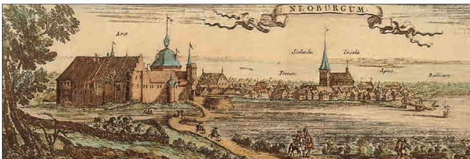
Figur 18. Prospekt af Nyborg 1659. Kobberstik fra Pufendorfs Atlas (1696) på baggrund af tegning udført af den svenske ingeniør Erik Dahlberg i 1659.