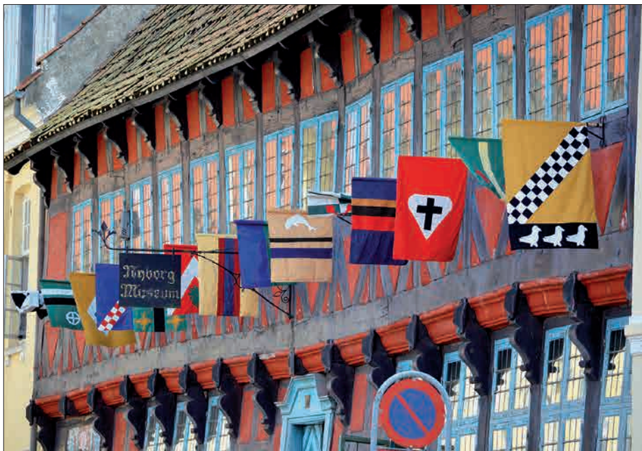
Figur 19. Billede af Borgmestergården med flag under Danehof i 2015.

Familien Lerche og dens tilknytning til historien spiller naturligvis en central rolle i den sammenhæng, og særudstillingen fortsætter nu som en del af de nye udstillinger på Borgmestergården.