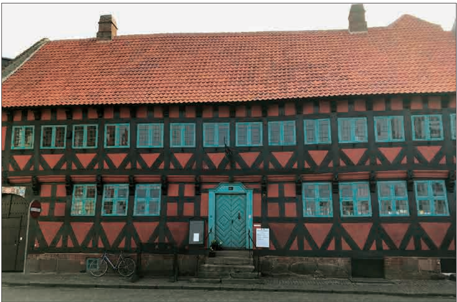
Figur 1. Borgmestergården er i årene 2016-17 blevet gennemrenoveret udvendigt og indvendigt. Her ses den restaurerede facade med det nye tag mod Slotsgade.

Familien Lerche var i renæssancen en af Nyborgs mest magtfulde familier. De var storkøbmænd og borgmestre, og deres hjem har både været et sæde for magten i byen og dannet rammen om et familieliv, som det har formet sig i en dansk købstad i renæssancen. Slægtens efterkommere