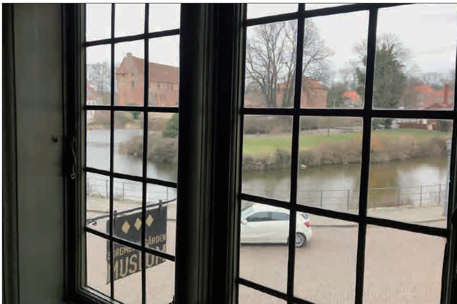
Figur 2. Udsigt til slottet og bygge- og restaureringsarbejderne, som man også kunne opleve i midten i af 1500-tallet.